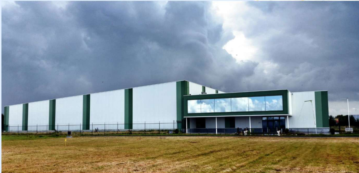
Ons nieuwe bedrijfspand voor Vercom België, per 15 oktober 2014

Nieuwsbrief uitgegeven door Vercom International Jaargang 2014 Uitgave september